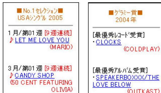
※画像は開発中のもので、実際の画面とは異なる場合がございます。

This Day In Music: 毎日更新。その日におきた過去の音楽ニュースをお届けします。